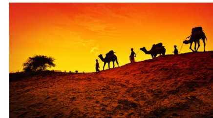
Epiphanie du Seigneur

Paroisse Saint-Potentien Secteur pastoral de Saint-Jean-les-Deux-Jumeaux